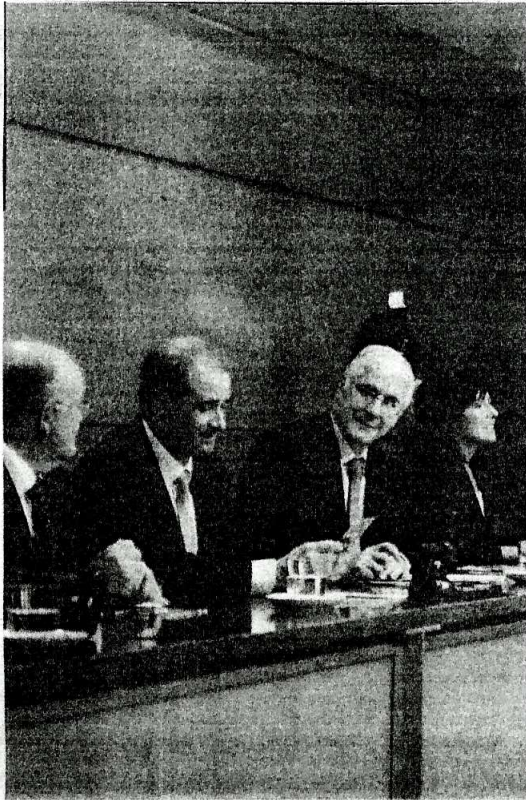
Un momento del acto de inauguración de las instalaciones.