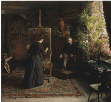
1. Jeanna Bauck (pintora sueca): La artista danesa Bertha Wegmann pintando un retrato (1870). Estocolmo, Museo Nacional de Suecia.

Moderna y, en concreto, sobre la importancia que adquieren los encajes en el atuendo femenino. La mujer perteneciente a la élite social fue una habitual consumidora de las diversas tipologías de encajes que se han elaborado en Europa durante la Edad Moderna.