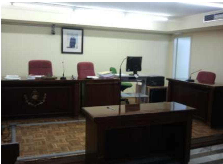
Sala de vistas. Juzgado de lo Social núm. 3 de Córdoba.

Como complemento necesario de la visita a las sedes judiciales y, como colofón de las actividades incluidas en nuestro proyecto, se han desarrollado reproducciones en el aula de procedimientos judiciales sobre Seguridad Social, partiendo precisamente del examen de demandas y sentencias concretas sobre distintas materias propias de la disciplina. Estas reproducciones judiciales han sido protagonizadas por los alumnos bajo la supervisión y seguimiento del Profesor.