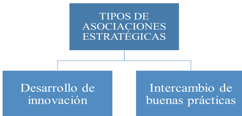
Figura 3. Tipos de asociaciones estratégicas

En cuanto a los tipos asociaciones estratégicas de existen numerosos tipos, pero en relación con nuestro proyecto en concreto, existen dos tipos principales, los cuales son las nombradas en párrafo anterior, es decir desarrollo de innovación e intercambio de buenas prácticas.