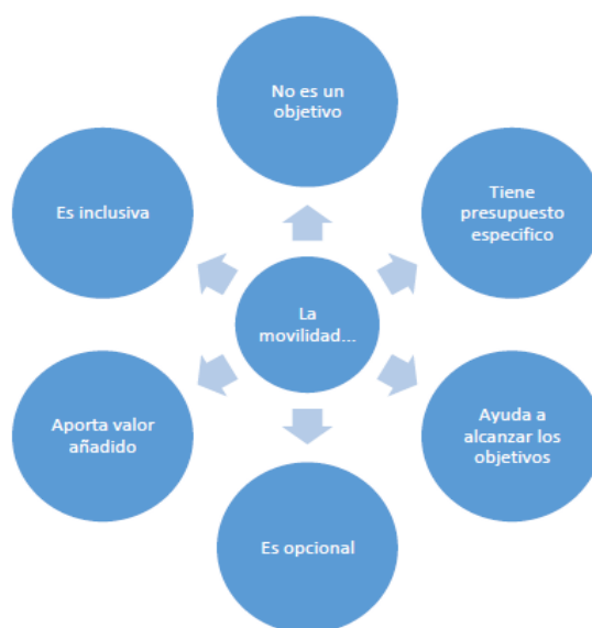
Figura 2. Características de la movilidad

Por otro lado, es de vital importancia hablar sobre la cuantía que se adjudica a cada institución, la cual depende directamente del número de personal enviado y de los estudiantes, así como también del personal que sea invitado procedente de empresas.