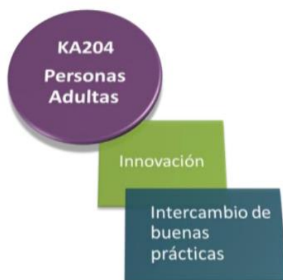
Figura 4. Asociaciones Estratégicas de apoyo al intercambio de buenas prácticas

Es importante tener en cuenta que, dentro del ámbito de la educación de las personas adultas, todos los proyectos que sean considerados como Asociación estratégica, debe de poseer una o más de las siguientes prioridades que se encuentran en la tabla, pudiendo ser prioridades horizontales y/o prioridades específicas dentro de la educación escolar, las cuales deben de ser seleccionadas en el formulario de la solicitud.